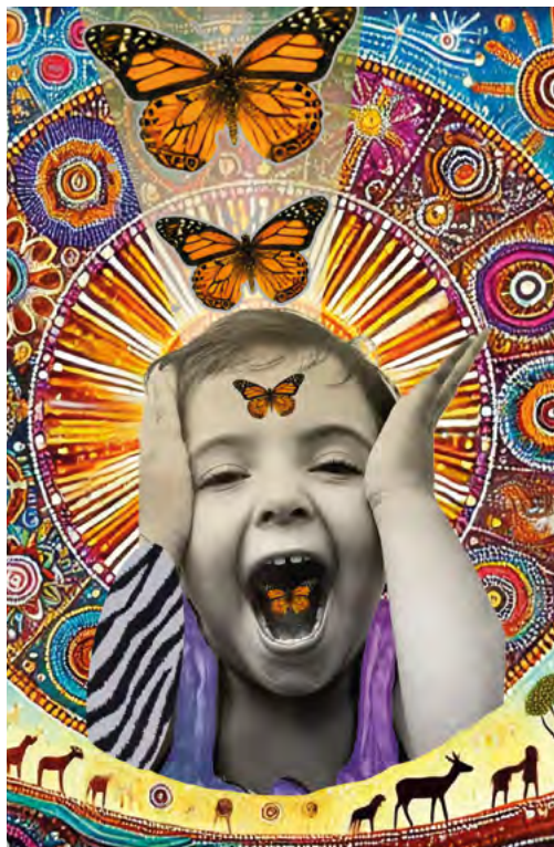
EXPOSITION LILI CROS